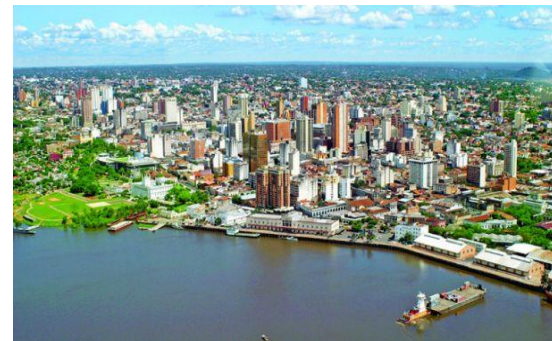
Universidad Nacional de Asunción