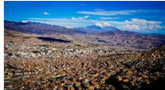
Universidad Católica Boliviana