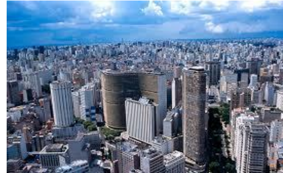
USP Universidade de São Paulo