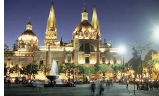
Universidad de Guadalajara